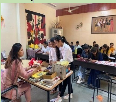
Fashion designing lab