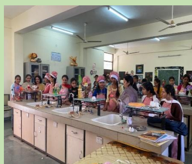
Home Science Lab